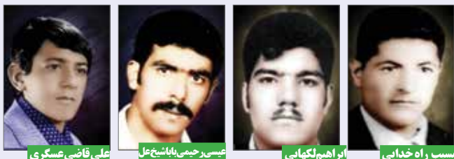
مسئوب راه خدایانی: ۱۳۶۰/۰۶/۲۶ شون ابراهیم لکمانی: ۱۳۶۱/۰۶/۲۹ خرمشهر عسیر حمید باهنر: ۱۳۵۹/۰۶/۲۹ سوسنگرد علی قاضی مسگری: ۱۳۵۸/۰۶/۲۵ کردستان