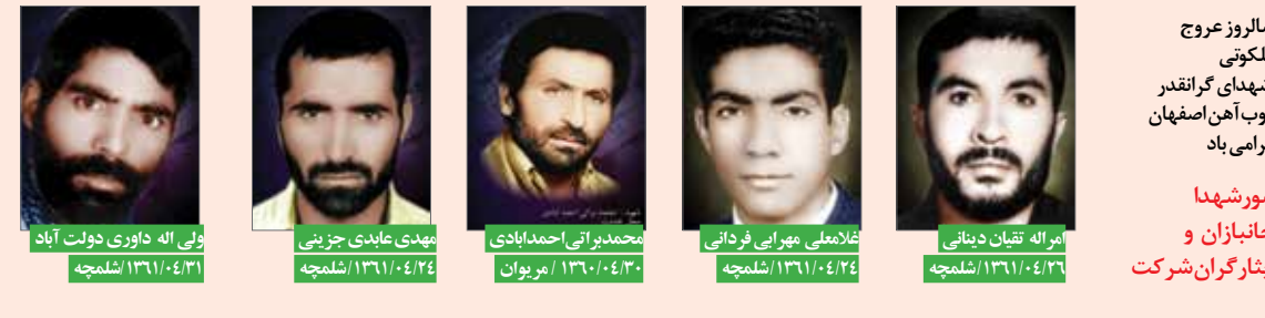
سالروز عروج ملکونی شهدای گرانقدر دوب آهن اصفهان گرمای یاد