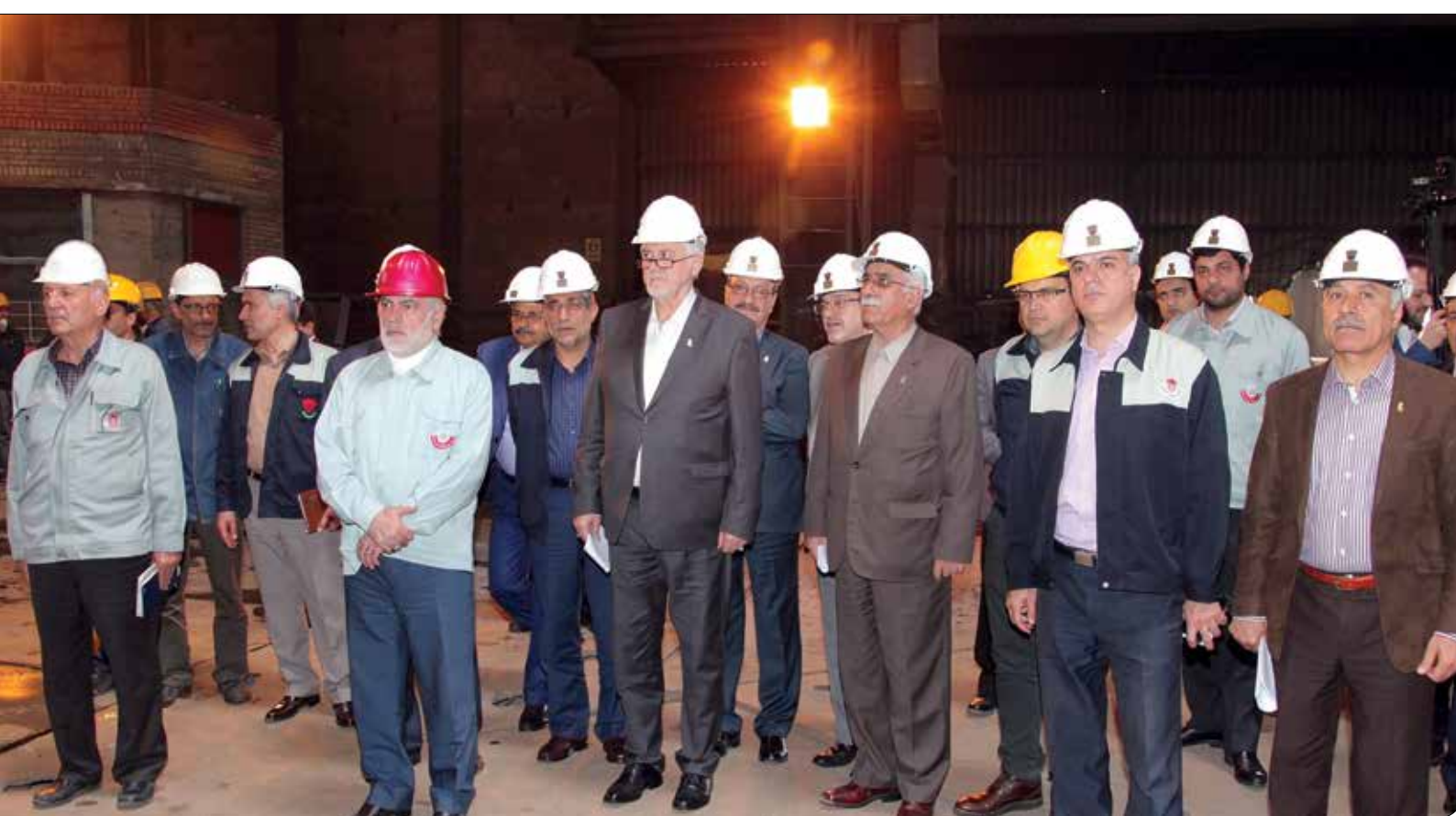
تأکید مهندس صادقی در جلسه کمیته عالی صادرات ذوب آهن: